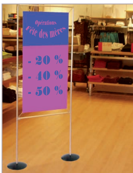
Basi in acciaio

Si adattano a tutti i nostri modelli di quadri. Esposizione fronte/retro. Colori Nero, blu, verde e trasparente.