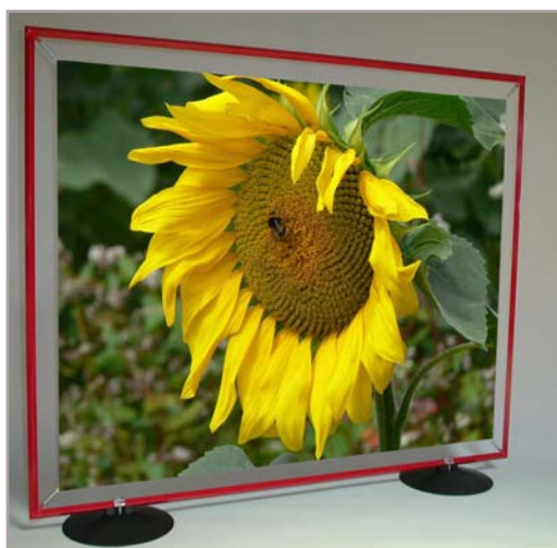
Basi plastiche rotonde

Si adattano a tutti i nostri modelli di quadri. Esposizione fronte/retro. Colori Nero, blu, verde e trasparente.